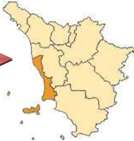
PROVINCIA DI LIVORNO